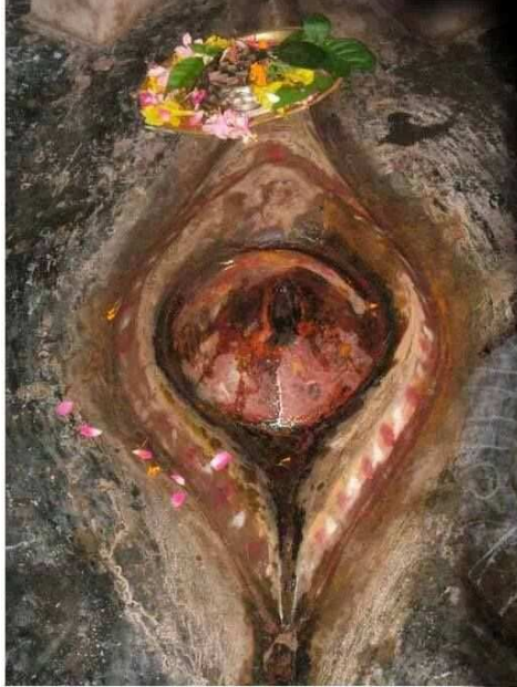
பெண் யோனி - [காமாக்ஷாதேவி கோவில் மூலவர்]