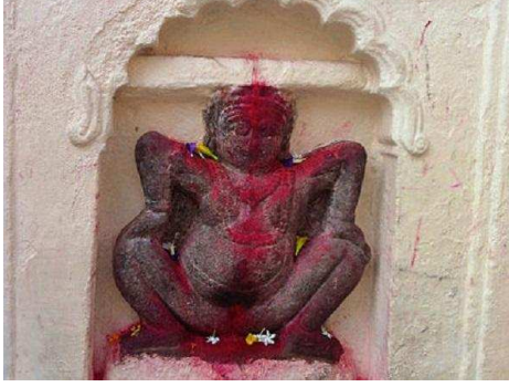
மாதவிடாய் வருகின்ற பெண் தெய்வம்