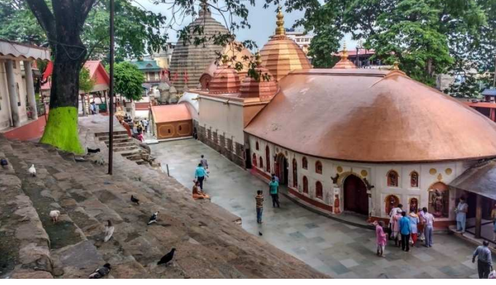
காமாக்யாதேவி கோவில் - அஸ்ஸாம் மாநிலம் [இந்த கோவில் 51 சக்தி பீடங்களில் ஒன்று]